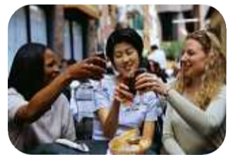
レストランでの食事