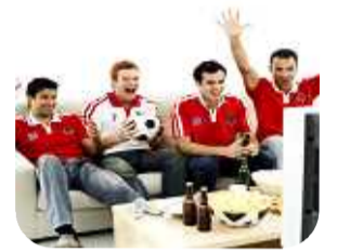
テレビや音楽を楽しむ

リオネット補聴器には、小型軽量タイプその他、障害者自立支援法対応タイプもあります。