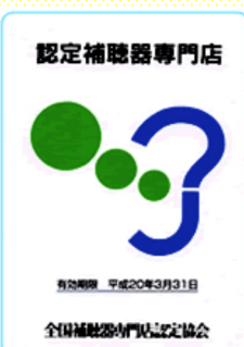
補聴器の購入はこの表示のお店で